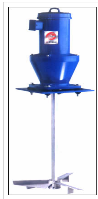
各类搅拌形式（叶轮）