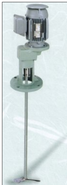
N T A