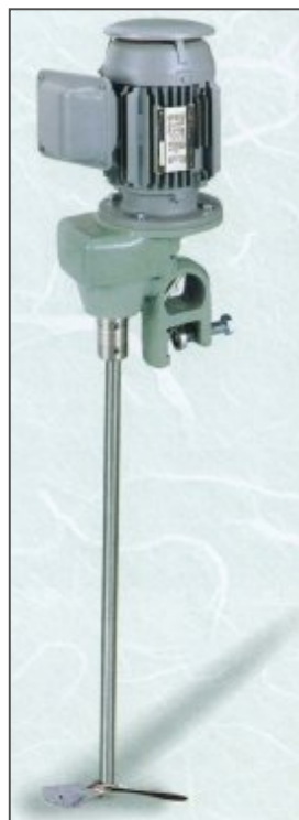
N K A